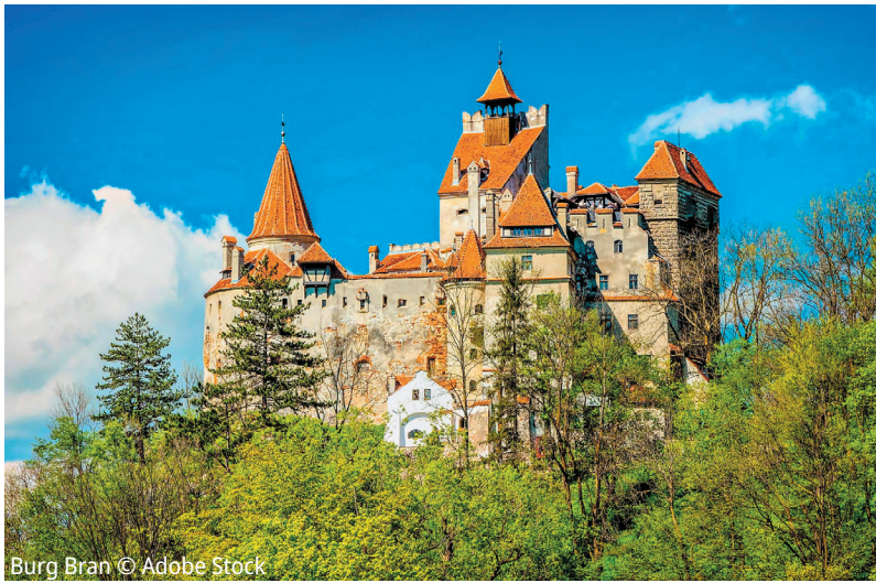
Burg Bran